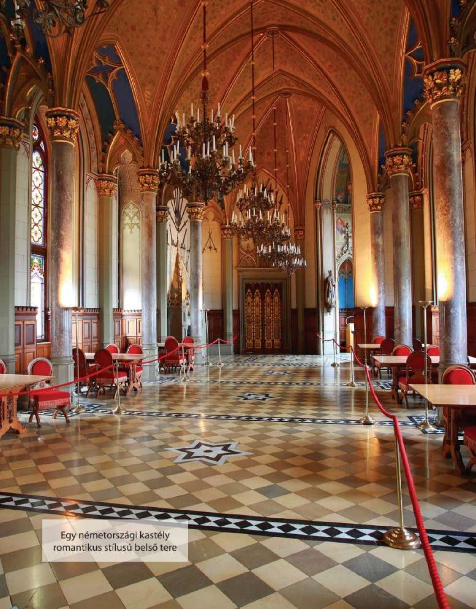
Egy németországi kastély romantikus stílusú belső tere